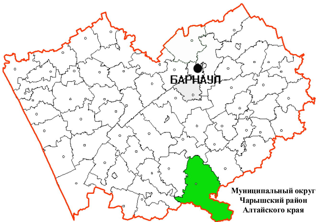
Рис. 1. Географическое положение МО Чарышский район Алтайского края

Чарышский район Алтайского края территориально расположен в южной части региона. Образован в 1924 году. В 2022 году преобразован в муниципальный округ Чарышский район Алтайского края. Площадь составляет 6910 км 2 . Центр муниципального округа – с. Чарышское – находится в 305 км от Барнаула. МО Чарышский район Алтайского края граничит: на севере с Усть-Калманским, на северо-востоке с Солонешенским, на западе с Краснощековским, на юго-западе со Змеиногорским районами Алтайского края, на востоке, юго-востоке – с Усть-Канским районом Республики Алтай, на юге – с государством Казахстан.