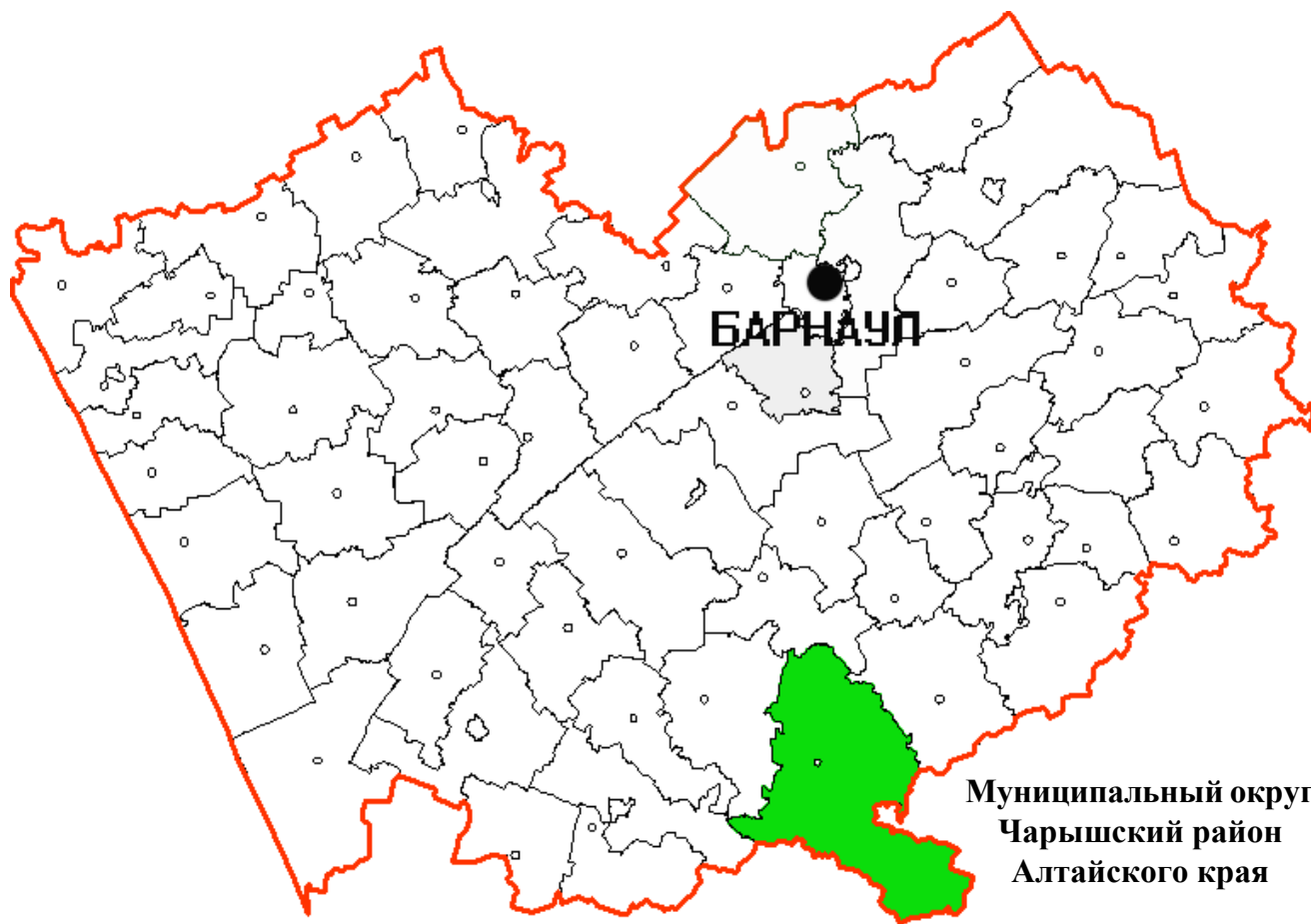
Рис. 1. Географическое положение МО Чарышский район Алтайского края

Чарышский район Алтайского края территориально расположен в южной части региона. Образован в 1924 году. В 2022 году преобразован в муниципальный округ Чарышский район Алтайского края. Площадь составляет 6910 км 2 . Центр муниципального округа – с. Чарышское – находится в 305 км от Барнаула. МО Чарышский район Алтайского края граничит: на севере с Усть-Калманским, на северо-востоке с Солонешенским, на западе с Краснощековским, на юго-западе со Змеиногорским районами Алтайского края, на востоке, юго-востоке – с Усть-Канским районом Республики Алтай, на юге – с государством Казахстан.